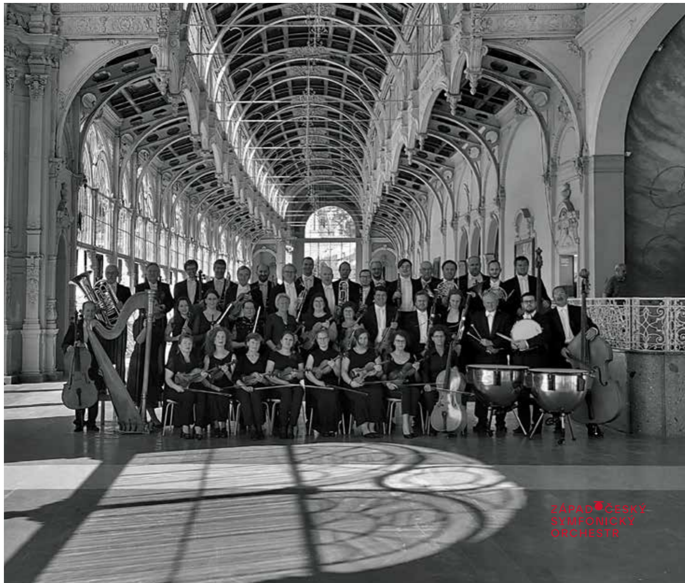
ZÁPAD ČESKÝ SYMPONICKÝ ORCHESTR